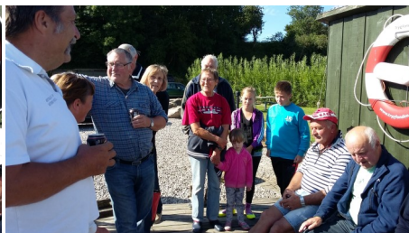
En stille stund før afgang