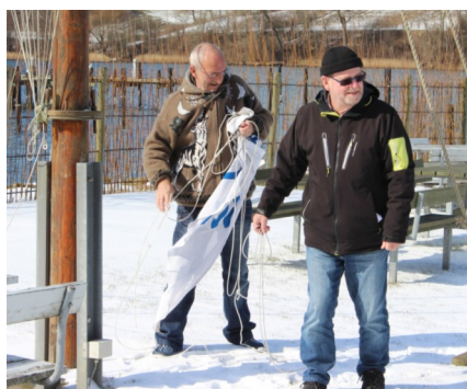
Gode råd er dyre ...