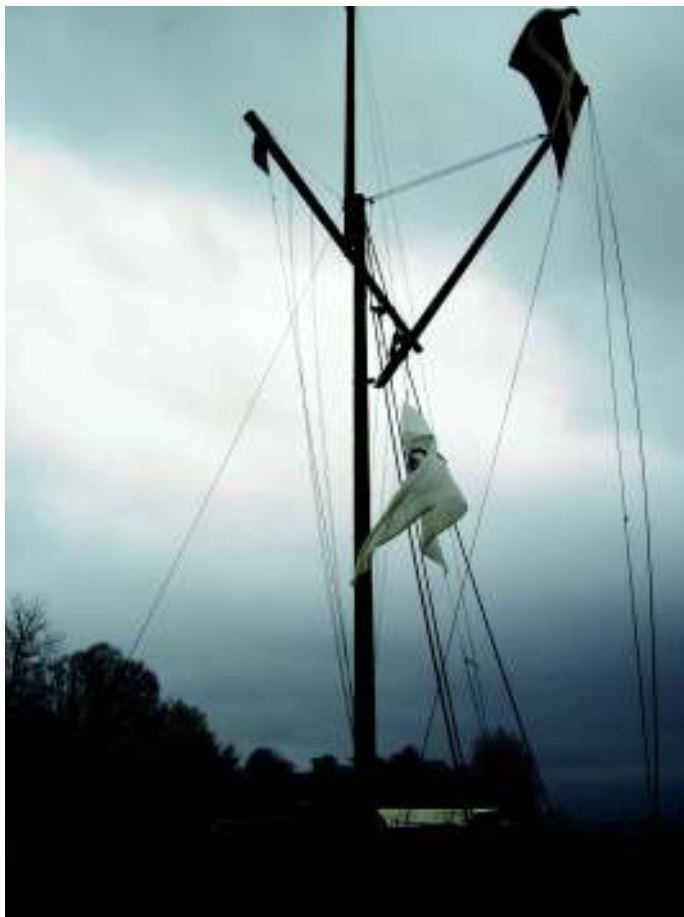
Dyvig standeren går atter til tops