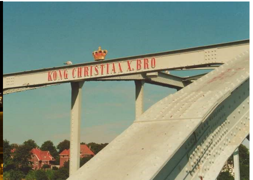
Kong Christian X. Bro Udskiftning af belægning på broklapper 2015