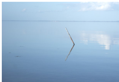
Helnæs i disen ...