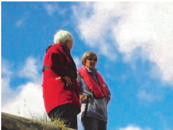
"Bolværksmatroserne" på arbejde.

Ruten vi sejlede ad, er utrolig smuk. Kanalens slyngninger førte os parallelt med Motalastrømmen, der går gennem to søer, Ljung-søen og Norrby-søen, og mellem Kanalen og Motalastrømmen løber pramdragerstien. Vi passerede 10 broer, og timingen var perfekt - vi ventede ikke et eneste sted på åbning. En sjov fornemmelse var det forresten, da vi sejlede over to akvedukter.